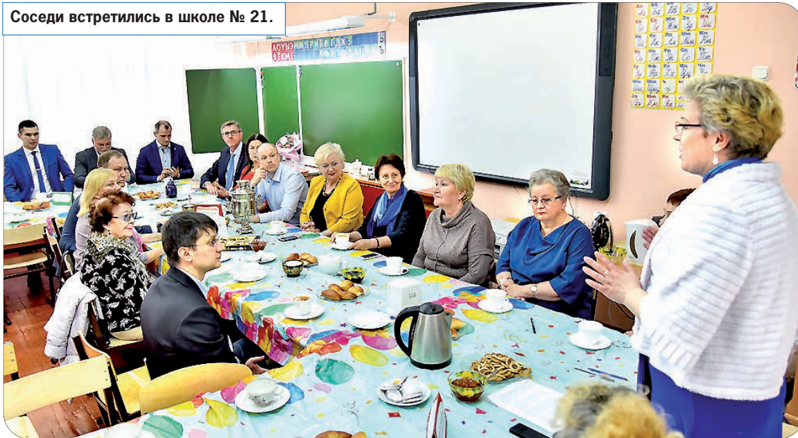
Соседи встретились в школе № 21.

За чаем и плюшками депутаты и представители городских ТСЖ обсудили серьезные вопросы. Одной из ключевых тем стал энергоэффективный капремонт с учетом по-